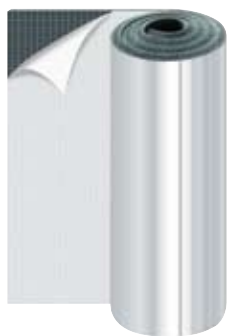
K-FLEX DUCT AL CLAD SYSTEM

K-FLEX DUCT NET öntapadó lap hálóval, AL CLAD SYSTEM kiviteltel (vastagság 400 µ). UV védelem